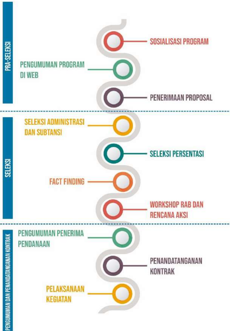
Gambar 4. Tahapan Pelaksanaan Kegiatan CPPBT-PT