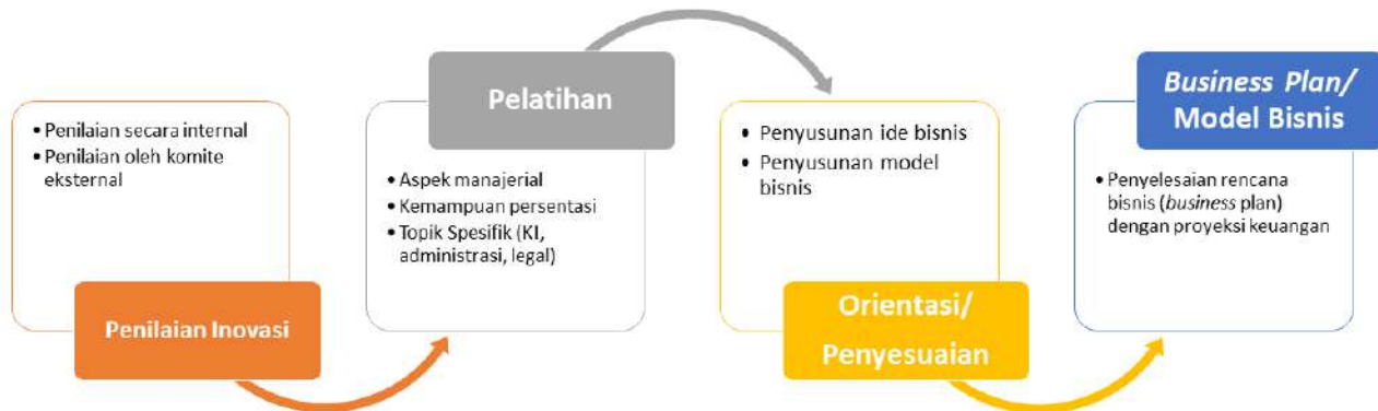
Gambar 3. Tahapan Pra-Inkubasi dalam program Pendanaan CPPBT PT