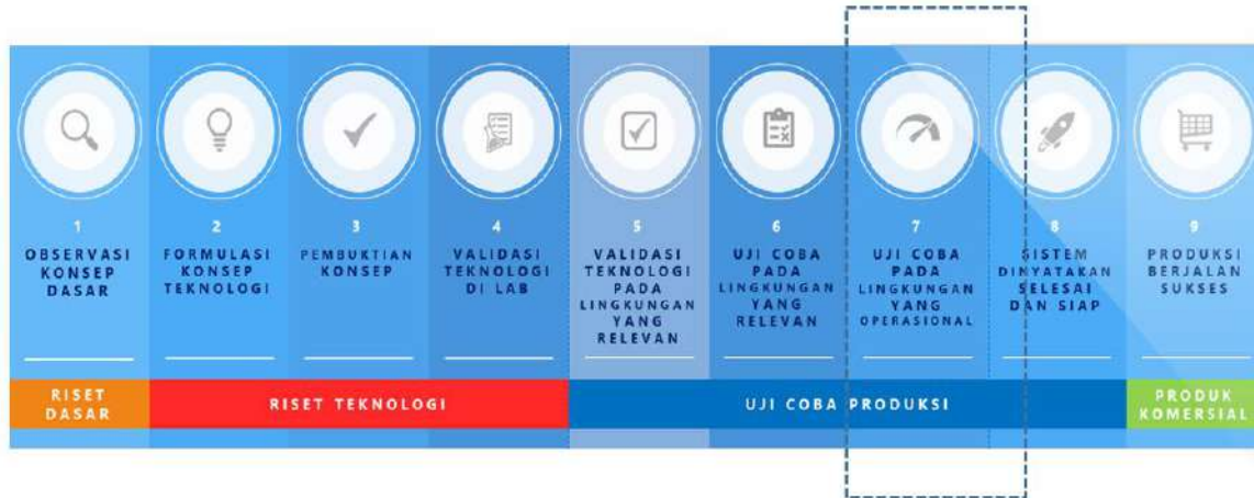
Gambar 1. Tingkat Kesiapan Teknologi ( Technology Readiness Level )